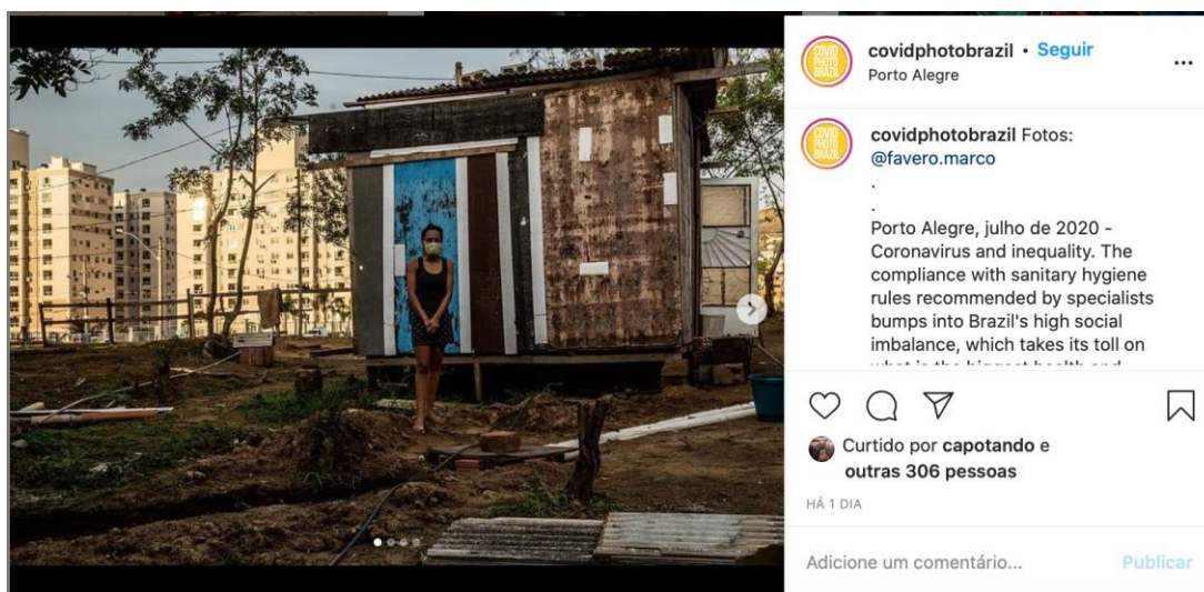
Figura 1. Imagem produzida por Marco Favero, em Porto Alegre, em julho de 2020

Assim, aplicamos as instruções sobre a investigação fotográfica adaptada por Kossoy (1999) para analisar as fotografias escolhidas sobre a pandemia da Covid-19.