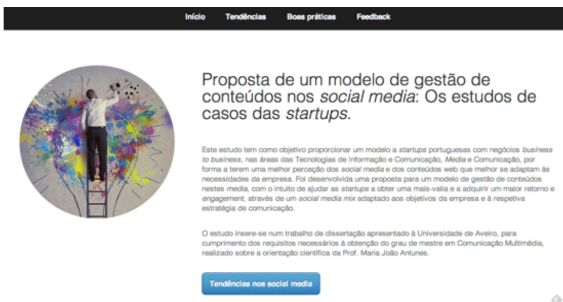
Figura 3: Homepage do website criado pela investigadora.

Após a tempo limite proposto às startups para facultarem feedback , 5 das 8 empresas inquiridas responderam, tendo todas dado uma validação positiva ao manual, o qual recebeu comentário muito positivos. As startups respondentes foram as seguintes: Startup A ; Startup J ; Startup L ; Startup N e Startup O . Eis os testemunhos recolhidos através do website: