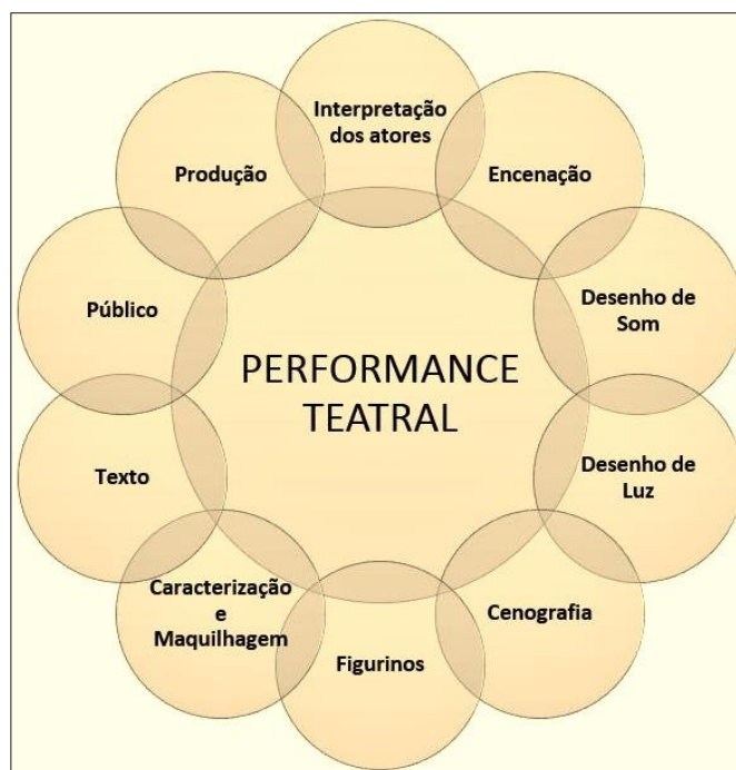
Figura 2 – Principais dimensões da performance teatral

Atentando ao que normalmente uma crítica de teatro contempla, e considerando a nossa dupla condição de leitores/espectadores, a interpretação dos atores e o trabalho da encenação, são porventura, os aspetos aos quais dedicamos mais atenção. Áreas como a cenografia, o desenho de luz, o desenho de som, os figurinos, a caracterização e maquiagem, o texto, a produção e até mesmo o público, são dimensões que, pela sua tecnicidade ou menor associação à significação imediata da performance teatral, têm vindo a merecer uma menor atenção por parte dos críticos de teatro. Neste sentido, era-nos essencial identificar e definir de um modo objetivo, os principais elementos caracterizadores de um espetáculo teatral, por forma a compreender quais os itens gerais que podem ser tidos em conta pelos críticos de teatro no seu processo de trabalho e estabelecer uma base teórica operacional que sustentasse as várias componentes empíricas da nossa investigação. A figura 2 ilustra de forma sucinta os principais elementos que constituem a performance teatral e que são suscetíveis de serem analisados pela crítica.